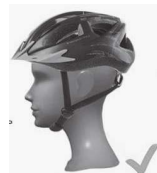
ПРАВИЛЬНА ПОСАДКА – ПЕРЕВІРТЕ, ЧИ ЗАКРИВАЄ ШОЛОМ ЛОБА.