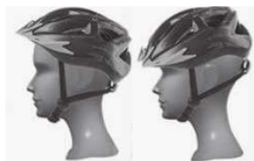
НЕПРАВИЛЬНА ПОСАДКА: ЛОБ ВІДКРИТИЙ ТА ВРАЗЛИВИЙ ДО СЕРЬОЗНИХ ТРАВМ АБО ШОЛОМ ЗАКРИВАЄ ОГЛЯД

ПЕРЕД ПЕРШОЮ ПОЇЗДКОЮ ПОВНІСТЮ ЗАРЯДІТЬ БАТАРЕЮ. Батарею потрібно повністю зарядити після отримання та відразу після кожного використання протягом рекомендованого часу для заряджання («Інформація про виріб»).